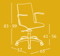
15 - Rb