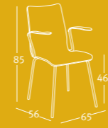
15 - Fb