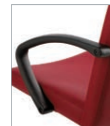
brazos poliuretano (estándar) accoudoirs polyuréthane (standard) polyurethane armrest (standard)