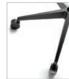
base piramidal poliamida (estándar) piètement pyramidale polyamide (standard) pyramidal polyamide frame (standard)