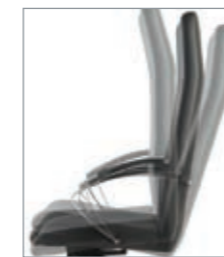
sistema sincro (5 posiciones) con regulación de tensión système synchro (5 positions) avec réglage de tension synchro system (5 positions) tension adjustment