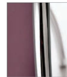
estructura cromo structure chromé chrome frame