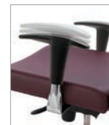
brazos regulables en "T" accoudoirs réglables en "T" adjustable armrests "T"-forme