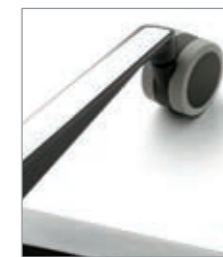
ruedas blandas roulettes sol dur soft wheels