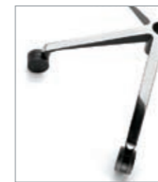
base piramidal aluminio pulido piètement pyramidale aluminium poli pyramidal aluminium frame