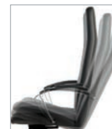
basculante Z (6 posiciones) con regulación de tensión basculant Z (6 positions) avec réglage de tension tilting Z (6 positions) tension adjustment