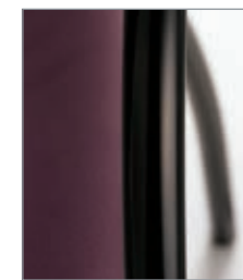
estructura epoxi negro structure époxy noir black epoxy frame