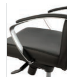
brazos metálicos tapizados accoudoirs métallique tapissés metallic upholstered armrests