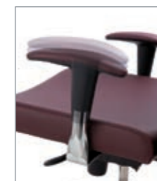
brazos regulables en "T" tapizados accoudoirs réglables en "T" tapissés adjustable upholstered armrests "T"-forme