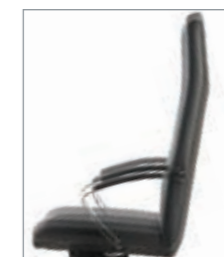
elevación a gas réglage à gaz gas adjustment